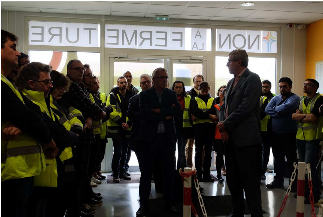
Au milieu du hall, devant le DG, le PRIX de « la CASSE du CEREMA »