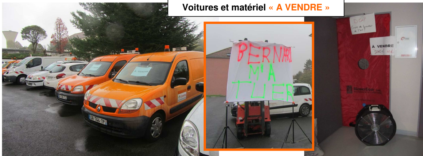
Voitures et matériel « A VENDRE »

Neuf jours après son annonce de projet de fermeture de la DTer IdF, le DG commençait sa tournée des directions du Cerema par le site de Sourdun (où ont été délocalisés les agents de l'ex-laboratoire de Melun et l'ex-Setra de Bagneux).